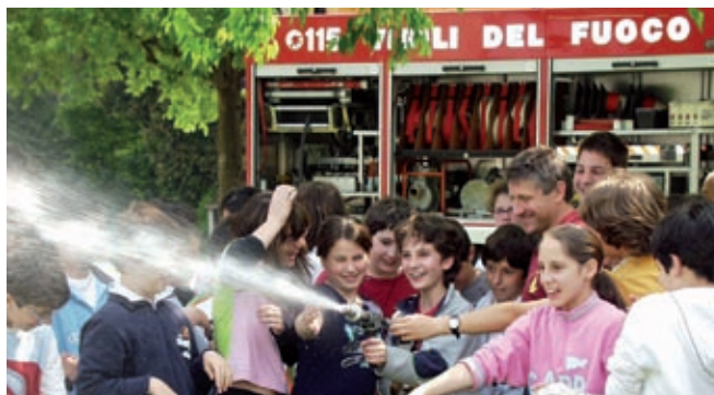
APPREZZAMENTO DEI VIGILI DEL FUOCO (MIN. 0, MAX 100)

Un risultato che induce a riflettere. Si sa che da sempre i vigili del fuoco rappresentano ovunque una sicurezza, un'istituzione che è vicina alla gente. Hanno sempre suscitato simpatia e molta soprattutto nei bambini,